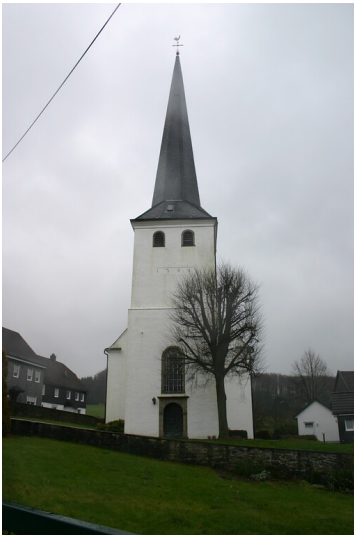
Evangelische Kirche von Remlingrade (2008)