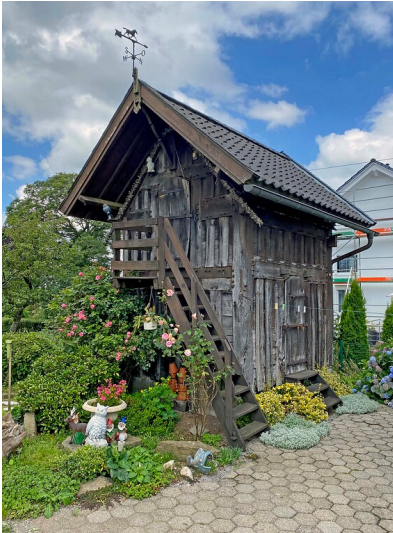
Haferkasten bei Haus 11 in Filde (2021)