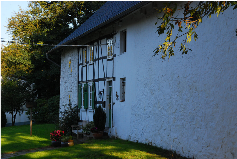
Teile der historischen Bausubstanz dieses Gebäudes datieren möglicherweise ins 17. Jahrhundert (2008)