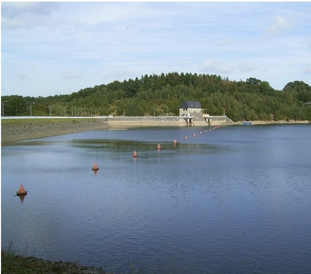
Staudamm der Wuppertalsperre in Radevormwald-Krebsöge (2007)