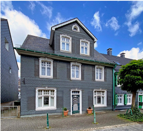
Wohnhaus Oststraße 3 in Radevormwald (2021)