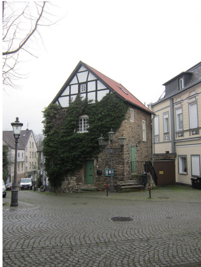
Essen-Rellinghausen, Gerichtsturm (2016)