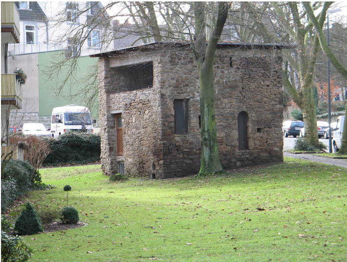
Stiepelturm in Essen-Rellinghausen, Blick von Norden (2011)