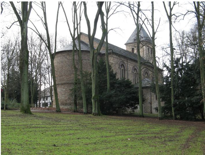
Stiftskirche St. Lambertus in Essen-Rellinghausen (2011)