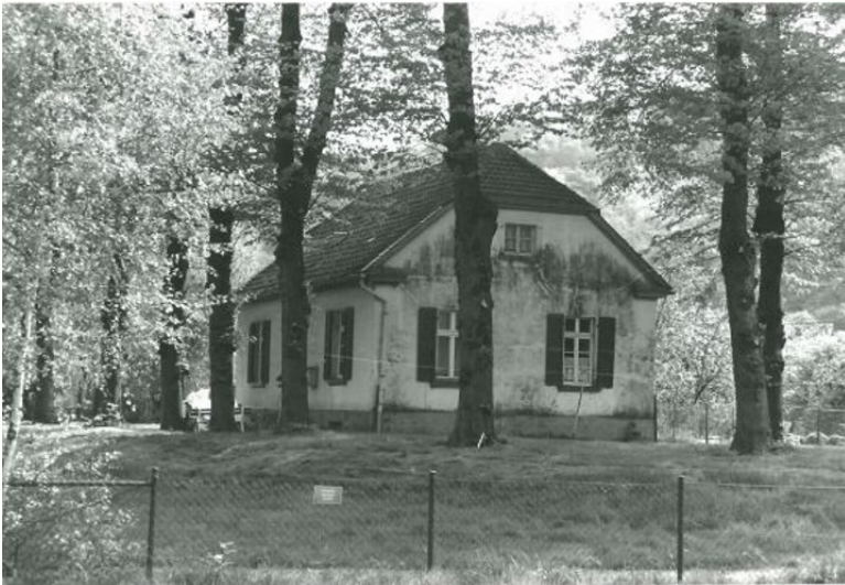
Schleusenwärterhaus der Papiermühlenschleuse in Essen-Werden