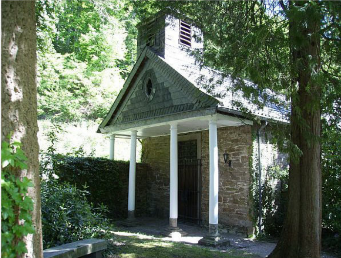
Hofkapelle bei Schloss Baldeney in Bredeney (2009)