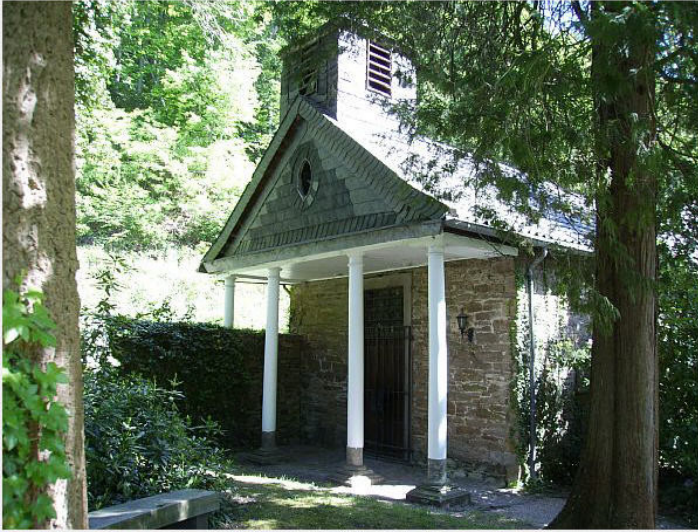
Hofkapelle bei Schloss Baldeney in Bredeney (2009)