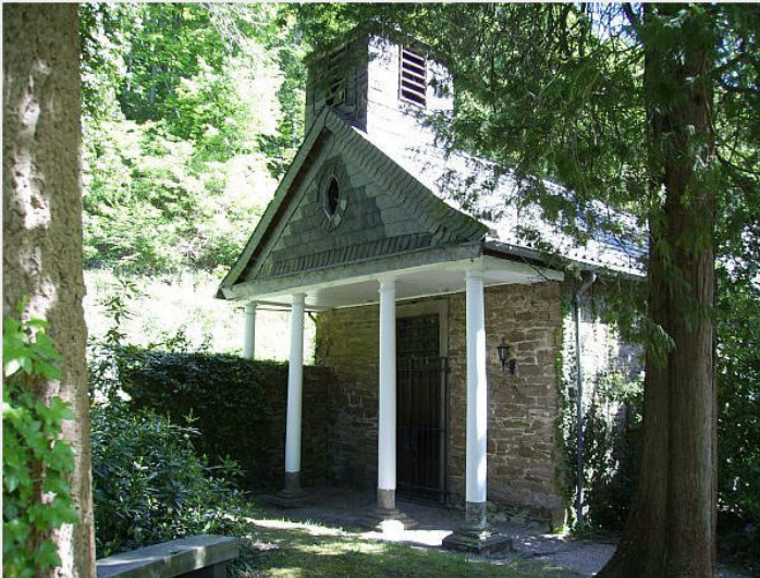
Hofkapelle bei Schloss Baldeney in Bredeney (2009)