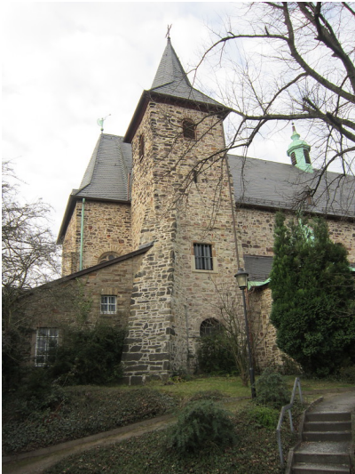
Essen, Karmelitinnenkirche in Stoppenberg. Blick auf den südlichen Turm des Westwerkes (2017)