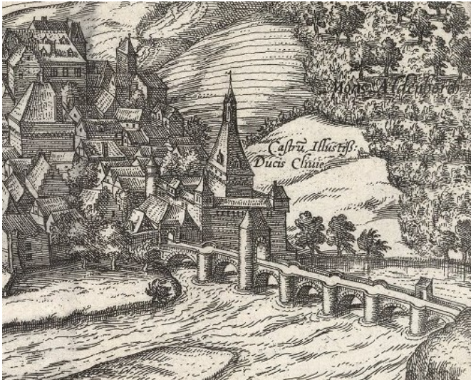
Ausschnitt eines Kupferstichs der ehemaligen Stadt Werden von Frans Hogenberg und Georg Braun (1581). Fotograf/Urheber: Frans Hogenberg; Georg Braun