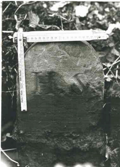
Lochstein Hammer Mark