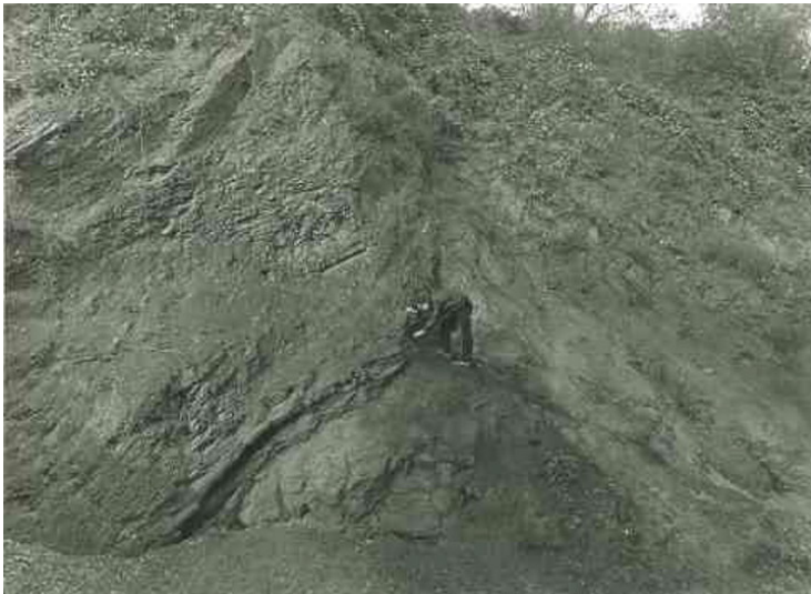
Geologischer Aufschluss an der Kampmannbrücke in Essen-Heisingen (2009)