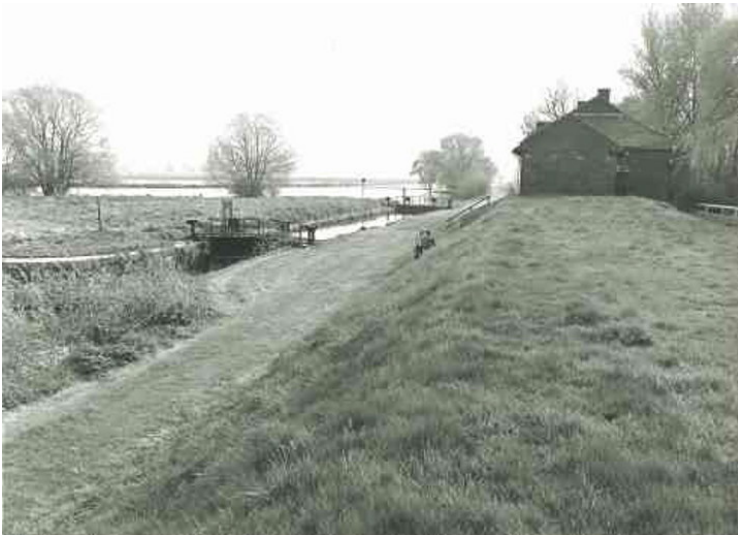
Spillenburger Schleuse in Essen-Überraehr-Hinsel