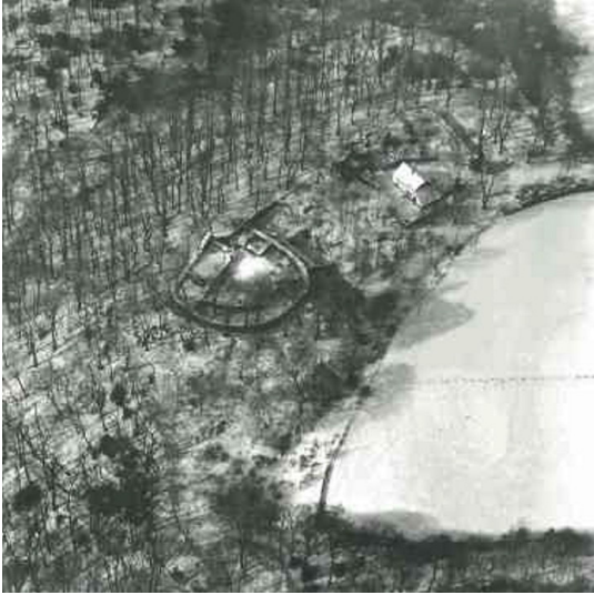
Neue Isenburg