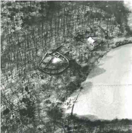
Neue Isenburg