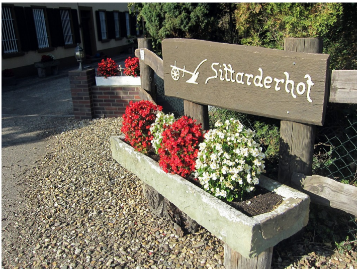
Eingang zum Sittarderhof bei Rommerskirchen, einem früheren Pachthof der Zisterzienserabtei Altenberg (2014).