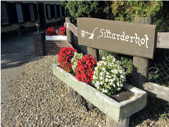
Eingang zum Sittarderhof bei Rommerskirchen, einem früheren Pachthof der Zisterzienserabtei Altenberg (2014).