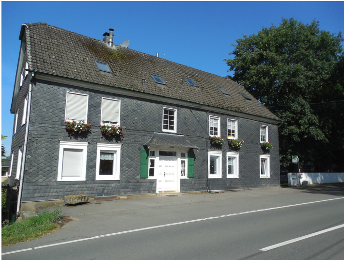
Hof Luchtenberg bei Wermelskirchen (2020)