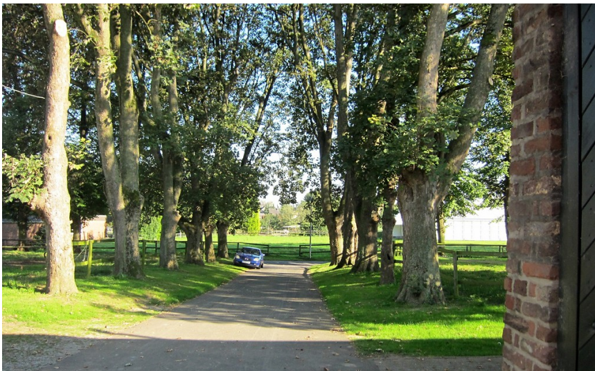
Die kleine Allee, die zum Lommertzhof bei Rommerskirchen führt (2014).