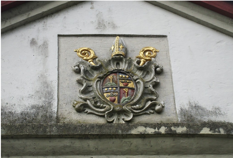
Wappenstein im oberen Bereich des Portals zum barocken Küchenhof der früheren Abtei Altenberg bei Odenthal (2017)