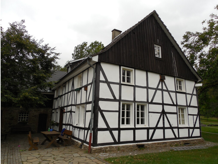
Kochshof bei Odenthal (2020)