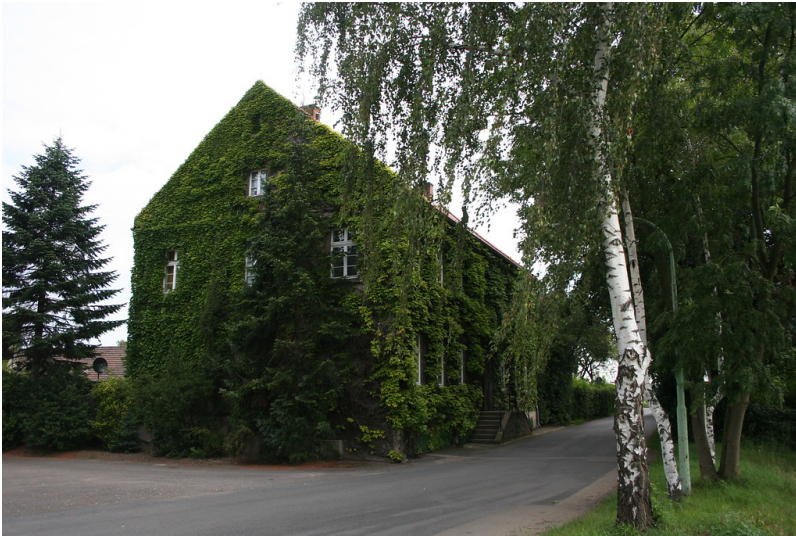
Gut Schönrath (2014)