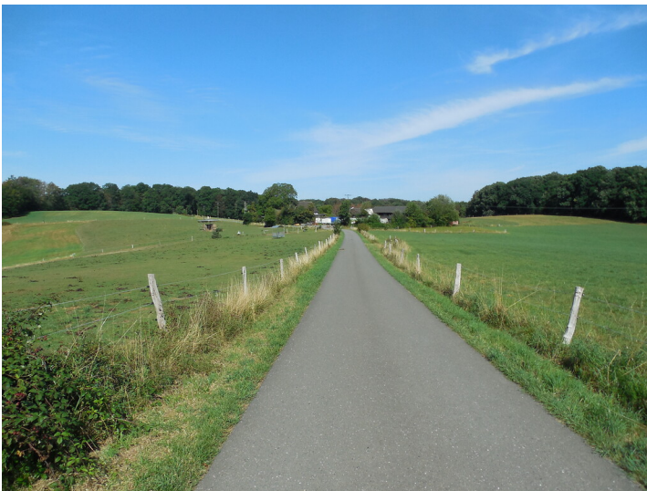
Hof Großspezard bei Odenthal (2020)