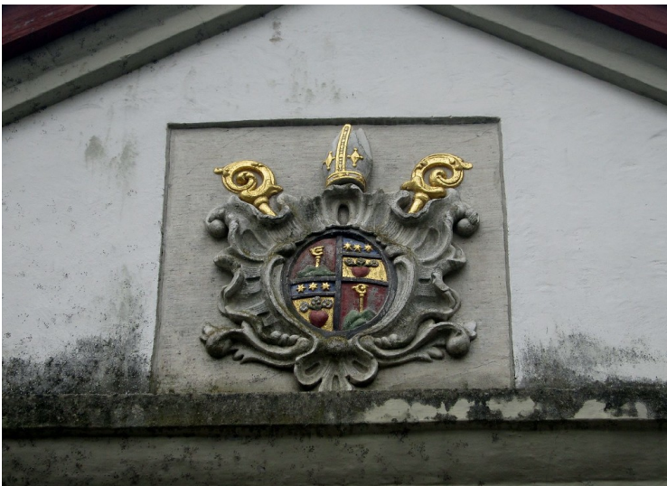
Wappenstein im Giebel des Portals des barocken Küchenhofs der Abtei Altenberg bei Odenthal (2012).