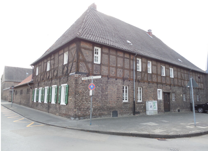
Bongartzhof in Köln-Flittard (2020)