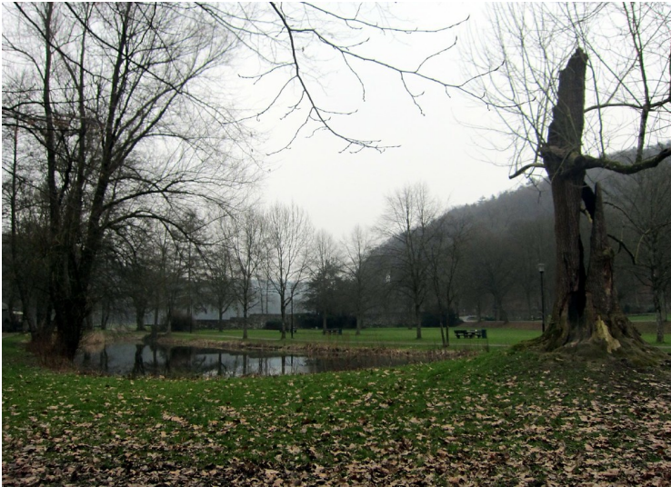
Klosterteich im Norden der ehemaligen Zisterzienserabtei Altenberg (2012)