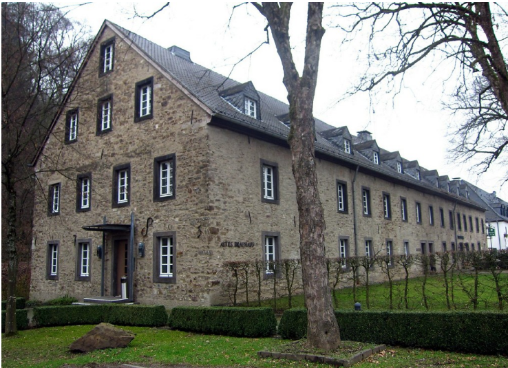
Zisterzienserabtei Altenberg, Altes Brauhaus (2012).