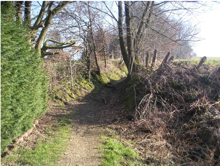
Hohlweg bei Herkingrade (2008)