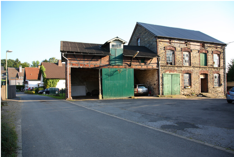
Blick auf die Brennerei in Herkingrade von Norden (2008)