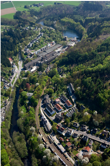
Stauanlage Dahlhausen an der Wupper, Radevormwald (2009)