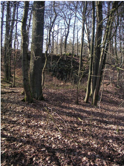
Steinbruch zwischen Niedernfeld und Krebsöge (2008)