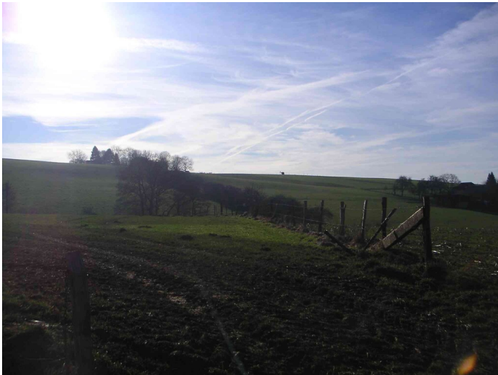
Flurhecke bei Karthausen (2008)