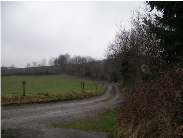
Der Hohlweg bei Ispingrade ist teilweise von Hecken begleitet (2008)