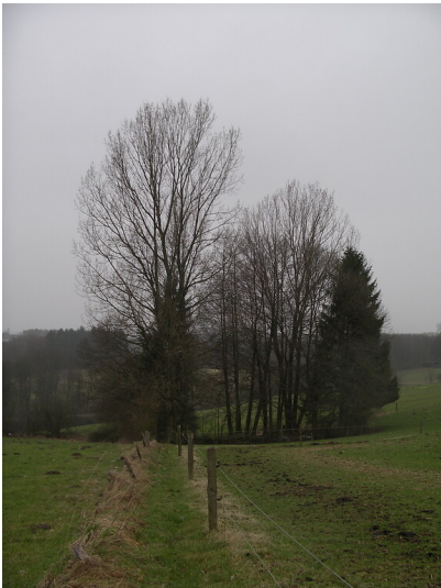
Teich zwischen Berg und Heide (2008)