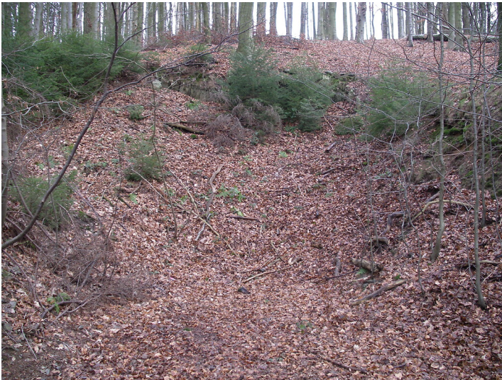
Anthropogene Spuren im Wald bei Honsberg (2008)