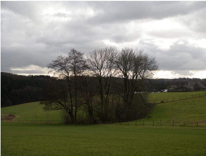
Teich bei Altenhof (2008)