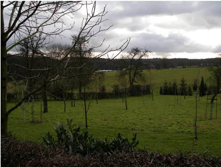
Obstwiese mit Weißdornhecke bei Altenhof in Radevormwald (2008)