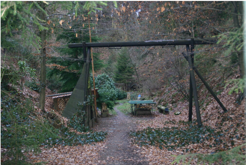
Der Weg führt in den großen Steinbruch östlich des Erlenbaches (2008)