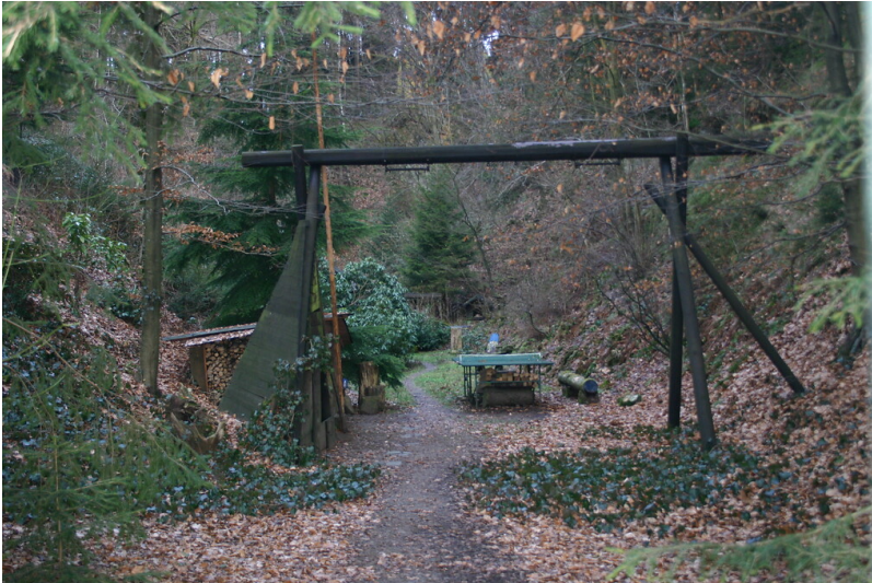
Der Weg führt in den großen Steinbruch östlich des Erlenbaches (2008)