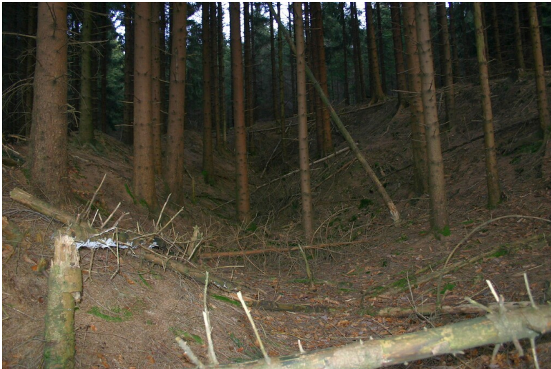
Steinbruch am Hohlwegbündel bei Erlenbach (2008)