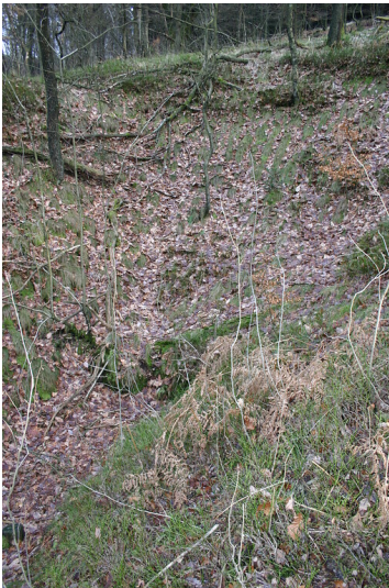
Bei der Geländevertiefung nahe Erlenbach handelt es sich vermutlich um einen Steinbruch (2008)