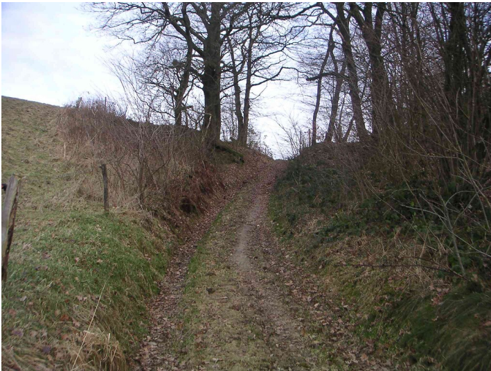
Hohlweg bei Kottmannshausen in Richtung Untergraben (2008)