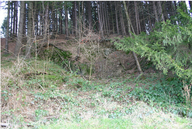
Der Steinbruch befindet sich in einem Nadelholzbestand bei Felsenbeck (2008)