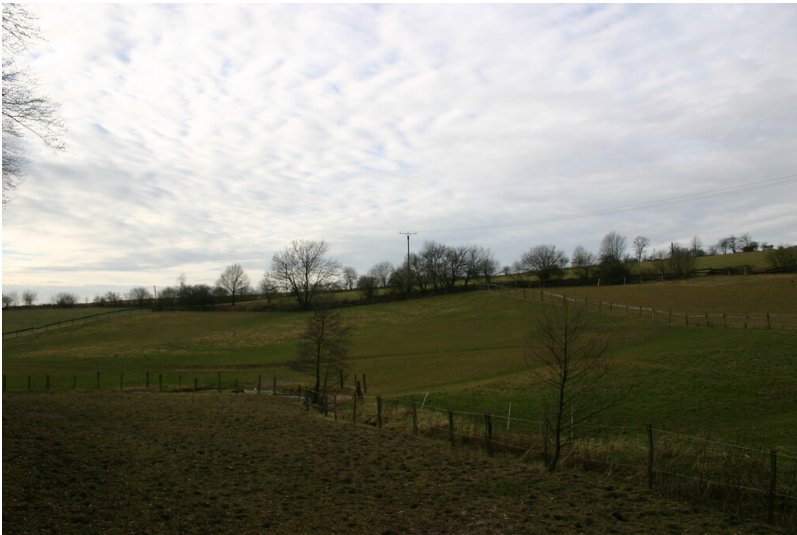
Hohlweg nordwestlich von Obergraben (2008)