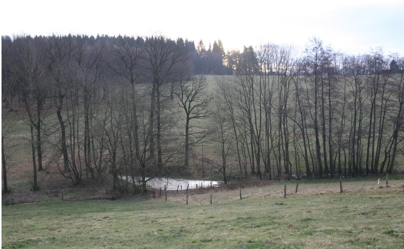
Der Teich zwischen Kettlershaus und Diepenbruch ist bereits auf der Preußischen Neuaufnahme um 1890 dargestellt (2008)