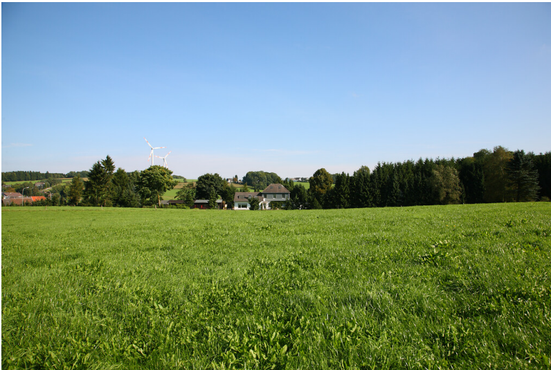
Bahnhof von Hahnenberg (2008)