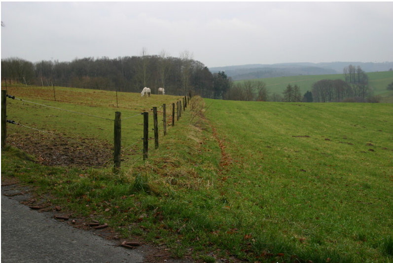
Wall entlang einer Gelände-parzelle bei Finkensiepen (2008)