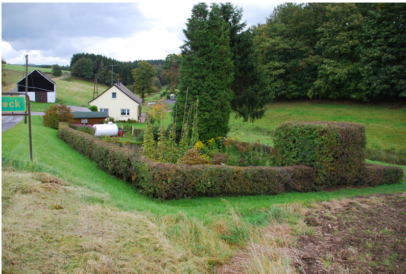
Bauerngarten in Umbeck (2008)