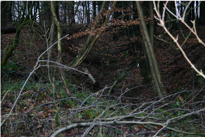
Hohlweg südlich von Obernhof (2008)